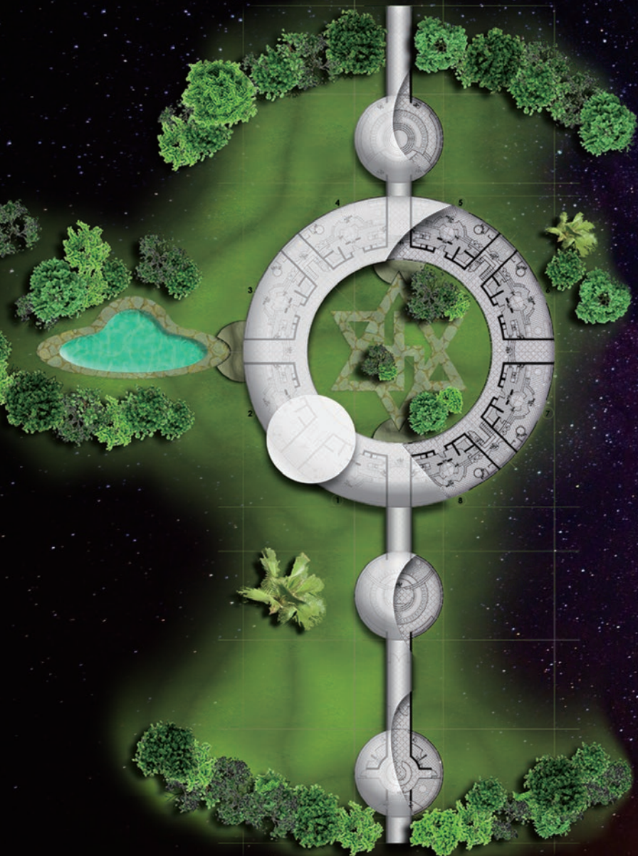
宇宙人大使館 完成イメージ